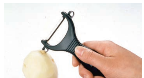
便利な芽取りつき