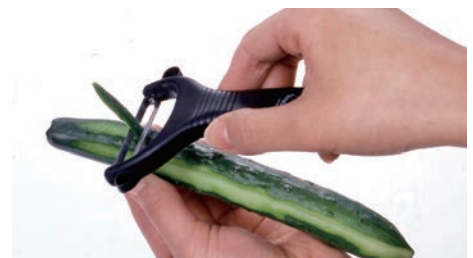
利き手を問わない使い勝手のいい設計