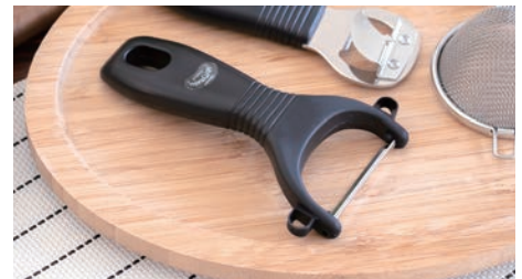
軽い力で皮がむける皮引きは、人気商品

開発当時は「ミセスの意見が素直にデザインされました」というキャッチコピーでデビューしました。使い勝手を重視した商品設計だからこそ、現在でも続くロングセラー商品となっています。