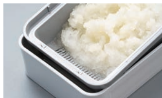
余分な水分がしっかり取れる水切り