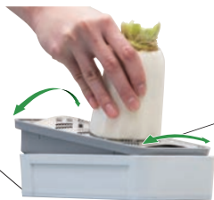
手前はきつく、奥は緩やかな形状の立体アーチのおろし金