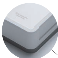
裏面に滑り止め付き

おろし金は、全体的に緩やかなアーチ状のカーブがかかっています。さらに、おろす手前がきつく奥は緩やかな形状なので、大根などの食材の断面が常におろしやすい角度になり、軽い力ですりおろすことができます。