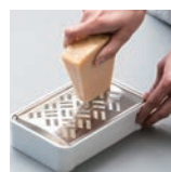
水切りを外せば、様々な食材をおろせます