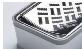
おろし金をひっくり返して安全に収納できます