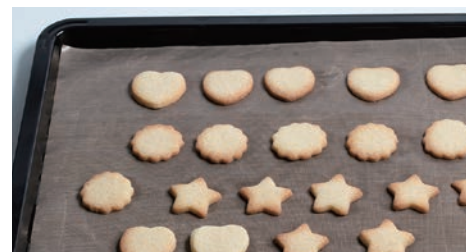
繰り返し使え、経済的なテラスオープンシート