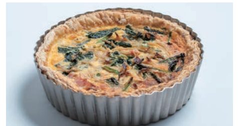
具だくさんのキッシュが焼けるタルト型（キッシュ）

切れ味がよく生地を傷めずにカットできるケーキナイフや、高品質な国産の製造技術に裏打ちされた泡立てなど、日本製の商品を多数取り揃えています。