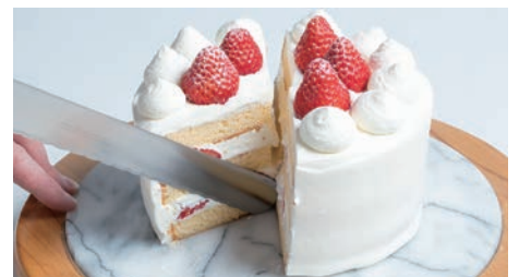
刃物のまち岐阜県関市で作られる切れ味のいいケーキナイフ