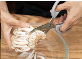
キノコやブロッコリーの下処理に