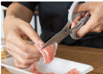
薄切り肉のカットに