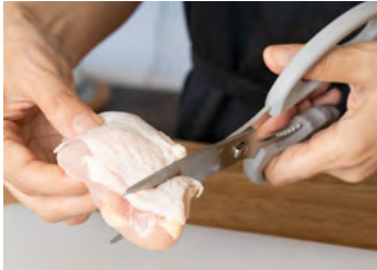
滑りやすい鶏肉の下処理に