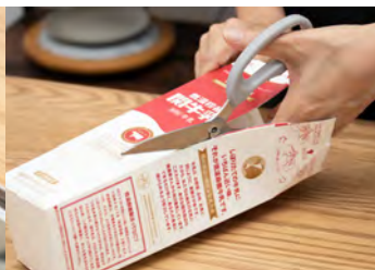
レトルトの開封や牛乳パックの解体に