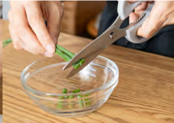
ねぎの小口切りに