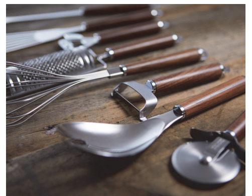
つなぎめのない一体加工で衛生的です。

日本製の確かな品質と機能性や作業性を追求した美しいフォルム。柄に使われているのは天然のウォールナット材。1点1点異なる木目なので、あなただけのオンリーワンとなります。天然木の優しい質感とステンレスの輝きがインテリアとしての存在感を放ち、キッチンに高級感をプラス。基本のツールに加え、サービングウェアも充実。ダイニングなどの食卓シーンを美しく演出します。