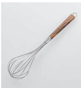
WT-08 泡立て Whisk

本体価格: 1,600円 ■材質/金属部: ステンレススチール、口金・フック・尻金: 真鍮にクロームメッキ、柄部: 天然木にウレタン塗装 ■寸法/約 290×70×70mm ■重量/約57g