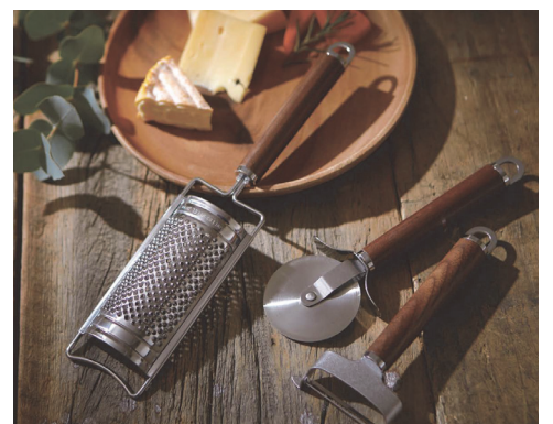
食卓を美しく演出する小物も充実しています。