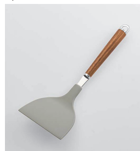
WT-12 ナイロン起し返し Nylon Small Turner

本体価格: 1,300円 ■材質/起し返し: ナイロン(耐熱温度180°C)、シャンク: 18-8ステンレススチール、口金・フック・尻金: 真鍮にクロームメッキ、柄部: 天然木にウレタン塗装 ■寸法/約 250×90×48mm ■重量/約64g