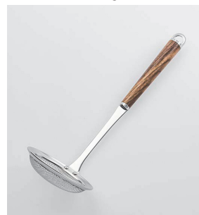
WT-06 かす揚げ Scum Strainer (Regular Mesh)

本体価格: 1,600円 ■材質/網・枠・シャンク: 18-8ステンレススチール、口金・フック・尻金: 真鍮にクロームメッキ、柄部: 天然木にウレタン塗装 ■寸法/約 280×90×80mm ■重量/約82g