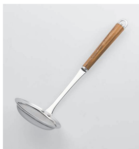
WT-07 あく取り Scum Strainer (Fine Mesh)

本体価格: 1,600円 ■材質/網・枠・シャンク: 18-8ステンレススチール、口金・フック・尻金: 真鍮にクロームメッキ、柄部: 天然木にウレタン塗装 ■寸法/約 280×90×80mm ■重量/約75g