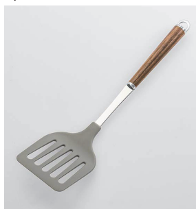
WT-10 ナイロンターナー Nylon Turner

本体価格: 1,300円 ■材質/ターナー: ナイロン(耐熱温度180°C)、シャンク: 18-8ステンレススチール、口金・フック・尻金: 真鍮にクロームメッキ、柄部: 天然木にウレタン塗装 ■寸法/約 305×80×45mm ■重量/約65g