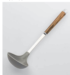
WT-09 ソフトお玉 Polypropylene Ladle

本体価格: 1,300円 ■お玉: ポリプロピレン(フッ素入)(耐熱温度110°C)、シャンク: 18-8ステンレススチール、口金・フック・尻金: 真鍮にクロームメッキ、柄部: 天然木にウレタン塗装 ■寸法/約 295×85×63mm ■重量/約65g ■容量/約75cc