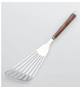
WT-05 バタービーター Beater

本体価格: 1,400円 ■材質/金属部: 18-8ステンレススチール、口金・フック・尻金: 真鍮にクロームメッキ、柄部: 天然木にウレタン塗装 ■寸法/約 315×80×18mm ■重量/約77g