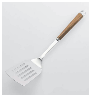
WT-04 ターナー穴あき Slotted Turner

本体価格: 1,500円 ■材質/金属部: 18-8ステンレススチール、口金・フック・尻金: 真鍮にクロームメッキ、柄部: 天然木にウレタン塗装 ■寸法/約 310×70×45mm ■重量/約82g