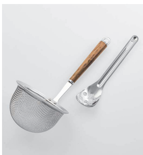
WT-14 みそこしセット Strainer & Masher Set

本体価格: 2,100円 ■材質/網・枠・シャンク・ヘラ: 18-8ステンレススチール、口金・フック・尻金: 真鍮にクロームメッキ、柄部: 天然木にウレタン塗装 ■寸法/約 325×115×110mm ■重量/約126g