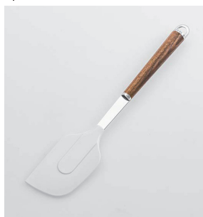
WT-13 ソフトヘラ Spatula

本体価格: 1,300円 ■材質/ヘラ: シリコーンゴム(耐熱温度220°C)、シャンク: ステンレススチール、口金・フック・尻金: 真鍮にクロームメッキ、柄部: 天然木にウレタン塗装 ■寸法/約 280×57×18mm ■重量/約73g