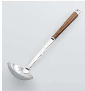
WT-01 お玉 (中) Ladle (M)

本体価格: 1,500円 ■材質/金属部: 18-8ステンレススチール、口金・フック・尻金: 真鍮にクロームメッキ、柄部: 天然木にウレタン塗装 ■寸法/約 295×80×68mm ■重量/約96g ■容量/約70cc