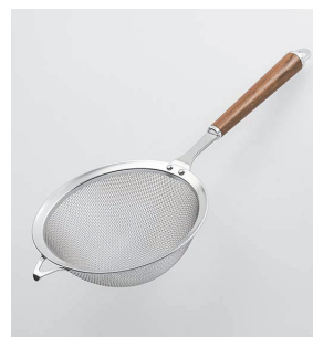
WT-15 万能こし Strainer

本体価格: 2,100円 ■材質/網・枠・シャンク: 18-8ステンレススチール、口金・フック・尻金: 真鍮にクロームメッキ、柄部: 天然木にウレタン塗装 ■寸法/約 325×115×60mm ■重量/約110g