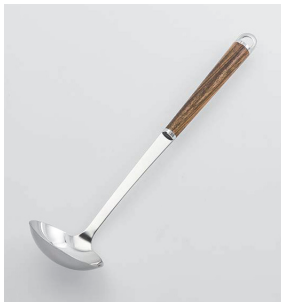
WT-02 お玉 (小) Ladle (S)

本体価格: 1,500円 ■材質/金属部: 18-8ステンレススチール、口金・フック・尻金: 真鍮にクロームメッキ、柄部: 天然木にウレタン塗装 ■寸法/約 285×70×63mm ■重量/約84g ■容量/約40cc