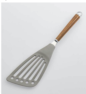
WT-11 ナイロンバタービーター Nylon Beater

本体価格: 1,300円 ■材質/バタービーター: ナイロン(耐熱温度180°C)、シャンク: 18-8ステンレススチール、口金・フック・尻金: 真鍮にクロームメッキ、柄部: 天然木にウレタン塗装 ■寸法/約 310×80×18mm ■重量/約69g