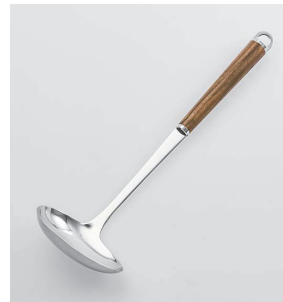
WT-03 横レードル Gravy Ladle

本体価格: 1,700円 ■材質/金属部: 18-8ステンレススチール、口金・フック・尻金: 真鍮にクロームメッキ、柄部: 天然木にウレタン塗装 ■寸法/約 290×90×57mm ■重量/約84g ■容量/約50cc