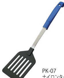
PK-07 ナイロンターナー

本体価格：1,250円 ■材質 / ヘラ、網: 18-8、シャンク・枠: ステンレス、柄部: ポリプロピレン ■寸法 / 約 280×92×95mm / 114g