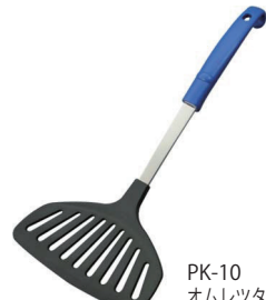
PK-10 オムレツターナー

本体価格：650円 ■材質 / 頭部: 66 ナイロン、シャンク: ステンレス、柄部: ポリプロピレン ■寸法 / 約 285×50×33mm / 43g