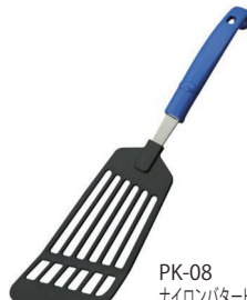
PK-08 ナイロンターナー

本体価格：650円 ■材質 / 頭部: 66 ナイロン、シャンク: ステンレス、柄部: ポリプロピレン ■寸法 / 約 325×75×26mm / 54g